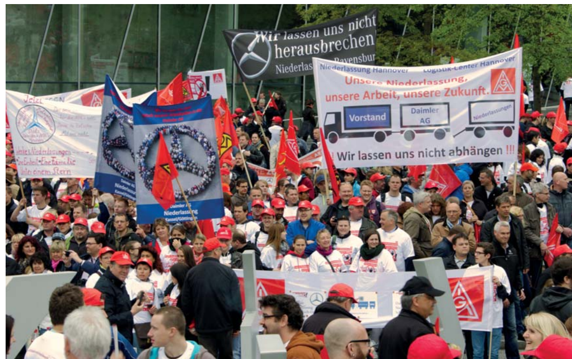
Stuttgart: Beschäftigte und Betriebsräte protestieren gegen den Verkauf von Niederlassungen.

Rund 4 000 Beschäftigte und Betriebsräte der konzerneigenen Niederlassungen protestierten Ende April in Stuttgart gegen die Pläne der Daimler AG. Der Konzern will die Umsatzrendite auf ganze zehn Prozent steigern. Er setzt dabei auch auf einen Kahlschlag im Vertrieb. Über 15 000 Beschäftigte in 33 Niederlassungen fürchten die Ausgliederung aus dem Unternehmen und den Verkauf von Betrieben bis hin zu ganzen Niederlassungen. Damit würden sie ihren jetzigen tariflichen Schutz verlieren. Ein „Zukunftssicherungsvertrag“ zwischen der Daimler AG und dem Gesamtbetriebsrat sowie der IG Metall schließt zwar den Verkauf von Niederlassungen bis Ende 2015 aus. Doch vernünftige Konzepte, die den Beschäftigten eine echte Zukunftsperspektive bieten, hat der Konzern bislang nicht vorgelegt.