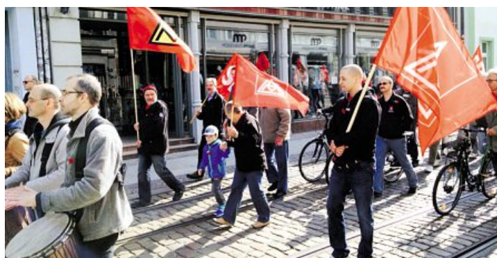
1. Mai in Brandenburg

IG Metall Potsdam, Breite Str. 9A, 14467 Potsdam, Telefon: 0331 20 08 15-0, Fax: 0331 20 08 15-15, E-Mail: potsdam@igmetall.de Redaktion: Bernd Thiele (verantwortlich)