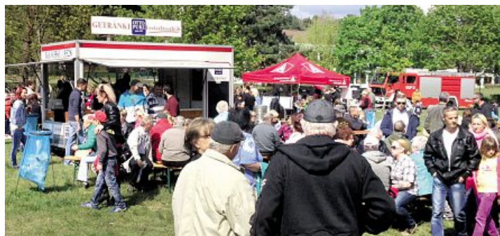
1. Mai in Eisenhüttenstadt

»Die Zukunft der Arbeit gestalten wir« – in Form von mehr Mitbestimmung und mehr Tarifbindung, war der Tenor der Diskussionen im Rahmen des Brückenfestes in der Oderstadt. Fachkräftemangel und Abwanderung könne nur durch gute und verlässliche Arbeitsbedingungen sowie mehr Mitbestimmung der Menschen in den Betrieben bekämpft werden. Wer glaube, durch Unsicherheit zukunftsfähig zu sein, setze auf das falsche Pferd. ■