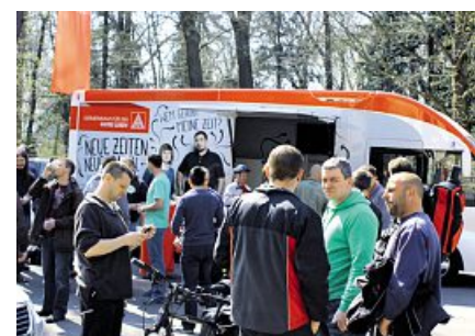
Beschäftigte trafen sich vor dem Wahllokal bei Accuma.

werden ihn natürlich auch weiterhin unterstützen. ■