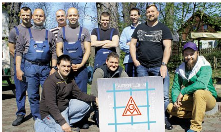
Beschäftigte wollen stufenweise Angleichung der Löhne an Metallindustrie.

Beschäftigte fordern einen Haustarifvertrag.