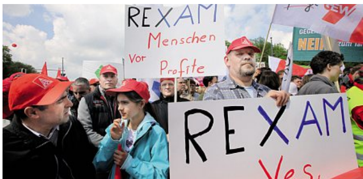
Rexam-Kolleginnen und Kollegen beim 1. Mai 2015 in Berlin

Internet: ▶ igmetall-berlin.de Redaktion: Andrea Weingart Verantwortlich: Klaus Abel