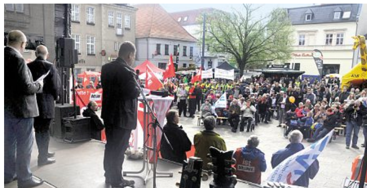
Blick von der Bühne in Eberswalde

Respekt! Kein Platz für Rassismus. Insbesondere die Mitglieder des Ortsjugendausschusses sowie