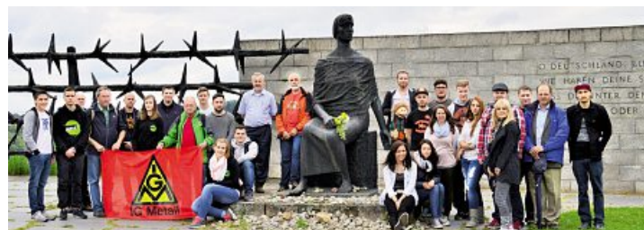
Die Delegierten aus unserem IG Metall-Bezirk bei der Besichtigung der KZ-Gedenkstätte Mauthausen

Selbst an einem so wichtigen historischen Ort zu sein und sich dadurch in die Menschen hineinzuversetzen, die diese schlimme Zeit erleben und ertragen mussten, ist das, was uns allen in Erinnerung bleiben wird und für uns als Gewerkschafterinnen und Gewerkschafter steht fest: »Widerstand leisten – zu jeder Zeit und überall.« ■