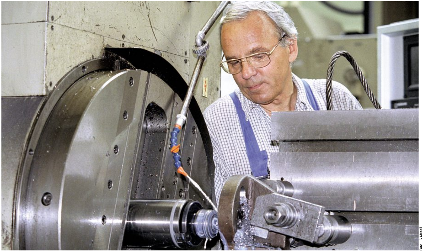
Alternde Belegschaften: Die Demografie-Falle schnappt im Osten früher zu als im Westen – wegen der Entlassungswellen nach 1990 und weil zu wenig ausgebildet wurde