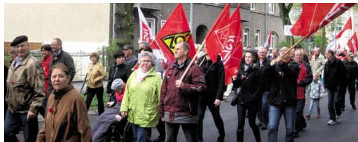
Demonstrationszug in Hennigsdorf