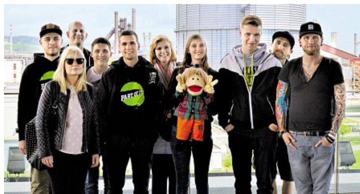
Die Delegierten aus Dresden und Riesa bei der Betriebsbesichtigung der voestalpine AG

Im Anschluss gab es die Möglichkeit, sich mit den Betriebsräten und den Jugendvertrauensräten von voestalpine auszutauschen. Themen waren unter anderem die unterschiedliche gesetzliche Arbeitsweise für Interessenvertreter in Deutschland und Österreich und wie die jeweilige Gestaltung der Tarifverträge aussieht.