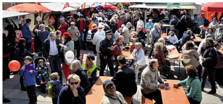
1. Mai in Potsdam